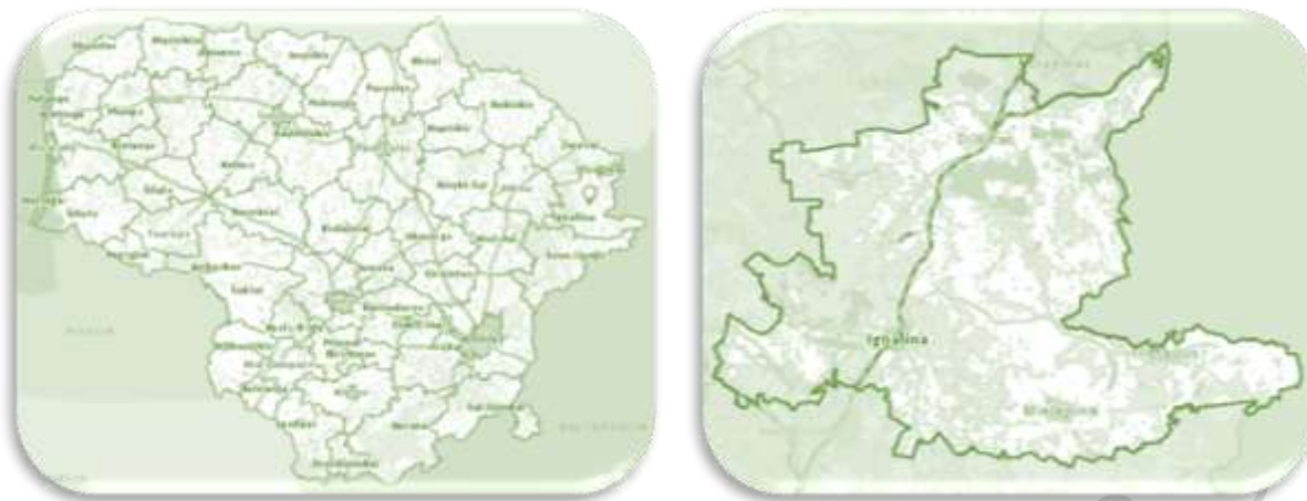
1 paveikslas. Ignalinos rajono savivaldybės teritorija, Šaltinis Regia.lt

Ignalinos VVG teritorijai būdingas raižytas reljefas, miškingumas, vandens telkinių gausa sukuria išskirtinį kraštovaizdį . Ignalinos rajonas – vertingų gamtinių ir rekreacinių resursų arealas. Čia įkurta pirmasis Lietuvos Nacionalinis parkas (1974 m.) 3 .