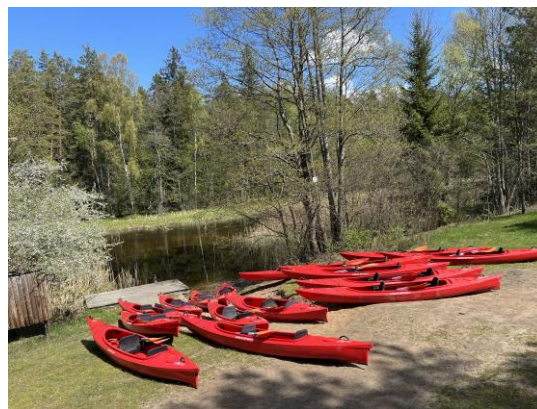
Paramos lėšos padėjo verslininkui įsigyti 76 baidares su GPS siūstuvais.